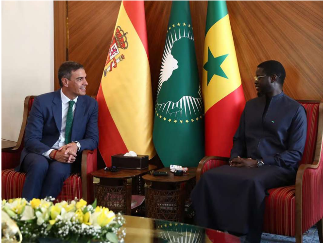
El presidente del Gobierno, Pedro Sánchez, y el presidente de la República del Senegal, Bassirou Diomaye Faye, durante el encuentro celebrado en el Palacio Presidencial de Dakar. 29-agosto-2024

da con los objetivos de soberanía económica del gobierno. Así, durante los últimos seis meses, el presidente Faye ha viajado a China, en el marco del foro de cooperación sino-africano (FOCAC), a Arabia Saudí, Qatar, Emiratos Árabes Unidos y Turquía. Los intercambios con Rusia a nivel ministerial y los acuerdos en materia de energía y seguridad alimentaria con este país siguen esta línea tradicional de la política exterior de Senegal.