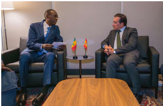
El ministro de Asuntos Exteriores Unión Europea y Cooperación Jose Manuel Albares se reúne con su homólogo de Senegal Cheikh Niang, en Nueva York 24/09/2025.

Ministro de Medioambiente, Desarrollo Sostenible y Transición Ecológica, Sr. El Hadji Abdourahmane Diouf