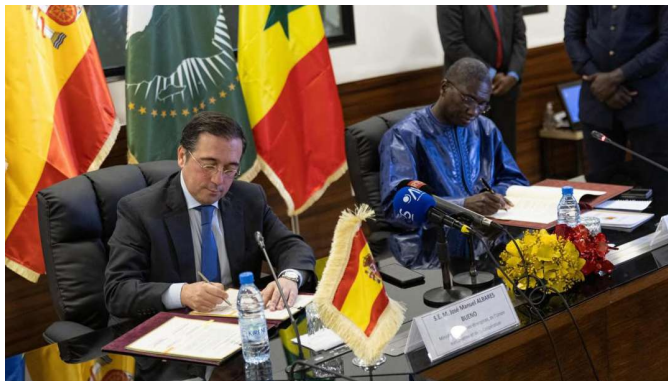
El ministro de Asuntos Exteriores UE y Cooperación español, José Manuel Albares, junto a su homólogo senegalés, Ismaila Madior Fall.-Dakar (Senegal) 15/12/2023.-foto: EFE