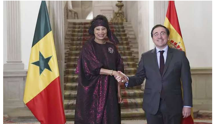
El ministro de Asuntos Exteriores, Unión Europea y Cooperación José Manuel Albares, con la anterior ministra de Asuntos Exteriores y de Senegaleses en el Exterior de la República del Senegal, Aïssata Tall Sall, en el Palacio de Viana.- Madrid 11 de enero de 2023.- foto: EFE