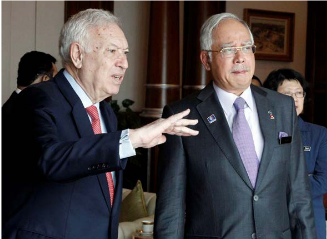
El anterior ministro de AA.EE y de Cooperación José Manuel García-Margallo, junto al entonces primer ministro de Malasia, Najib Razak, durante su visita a Kuala Lumpur en marzo de 2014.

la compra de laboratorios españoles y la construcción del centro. Ya se han graduado las primeras promociones de estudiantes del MSI.