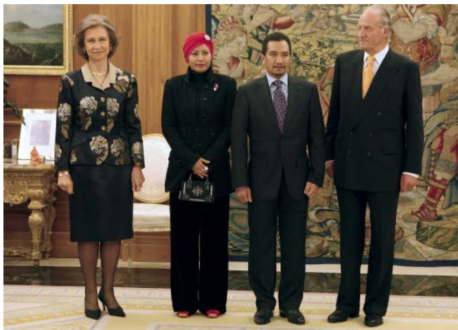
SS MM los reyes de España, junto a SS MM los reyes de Malasia, durante la visita oficial que realizaron a España, en octubre de 2008.